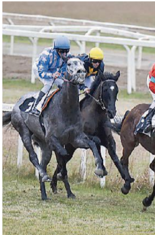
Una corsa al galoppo