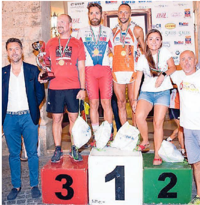
Il podio con i vincitori